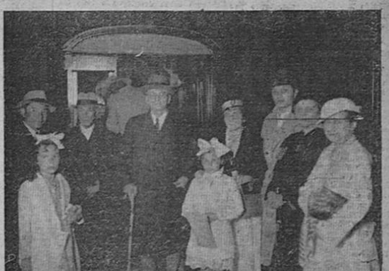
Don CARLOS SOLORZANO, la noche en que llegó a Costa Rica y posando especialmente para DIARIO DE COSTA RICA

Fue una profunda sensación de dolor la que experimentamos al recibir, a eso de la media noche, la infausta nueva de haber fallecido en esta capital, en su elegante residencia de la avenida central recientemente construida por él, don Carlos Solórzano, ex presidente de Nicaragua y personalidad meritalma que honraba con su presencia a Costa Rica.