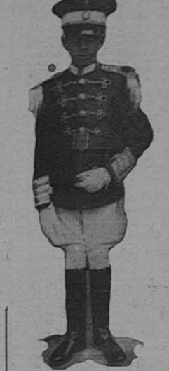
El Principe Makenen, Duque de Harrar

La alcaldía primera penal inició ayer los procedimientos en una denuncia por deslealtad conyugal y falsificación de un documento público. Según los detalles del expediente, un individuo de esta capital se presentó ante el Registro Civil a inscribir como legítimo a un hijo adulterino. Su esposa, que conmo le expresa en el escrito, ha tolerado las relaciones ilícitas de su esposo, pide sanción para los dos delictos. En el primer caso, esta es, en el de deslealtad conyugal acusa a su esposo y a su amante y en el segundo, o sea, el referente a la falsificación del documento público, promueve acción contra su esposo únicamente.