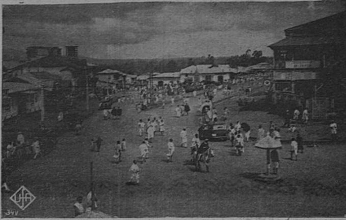
La fotografía presenta un aspecto de la plaza del correo en Addis Abeba, que se encuentra en vísperas de caer en manos de las fuerzas italianas.