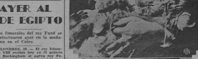
BERLIN. — Wilhelm Goering, vice-canciller de Alemania, acaricia a su mascota. Tal vez Goering esté pensando que algún día podrá dominar al León Británico en igual forma.